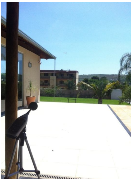
Figura 1 – Detalhe do medidor de ruído em Confins/MG