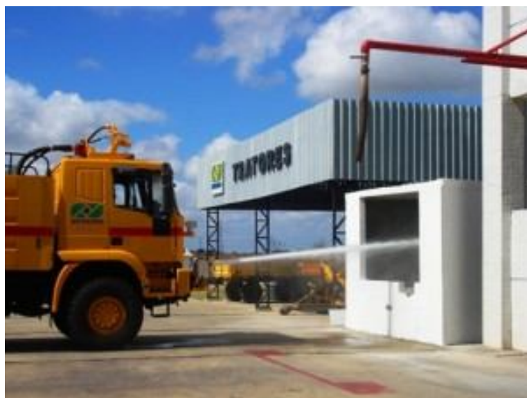
Figura 5 – Caminhão realizando teste diário com reaproveitamento de água.